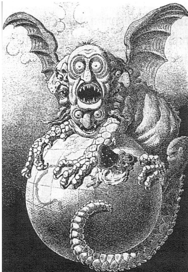
Франц. карикатура: еврей, оседлавший земной шар

Царя-деспота Сионской крови... мы готовим для мира».